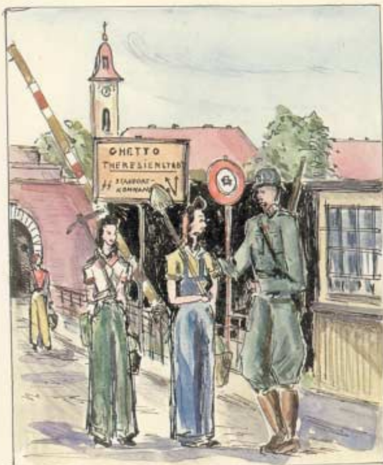
At the border Terezin - southern gate

Girls working in the "H-garden" were not allowed to pick up even a single potato.