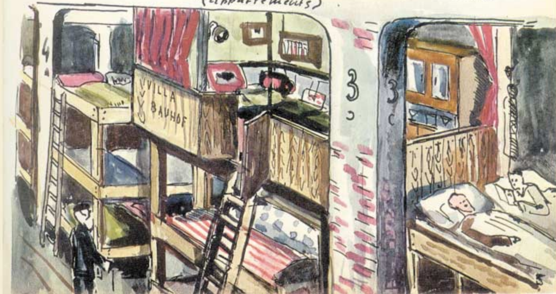
בעזרת קרשים גנובים, על הדרגשים "בונים דירות".