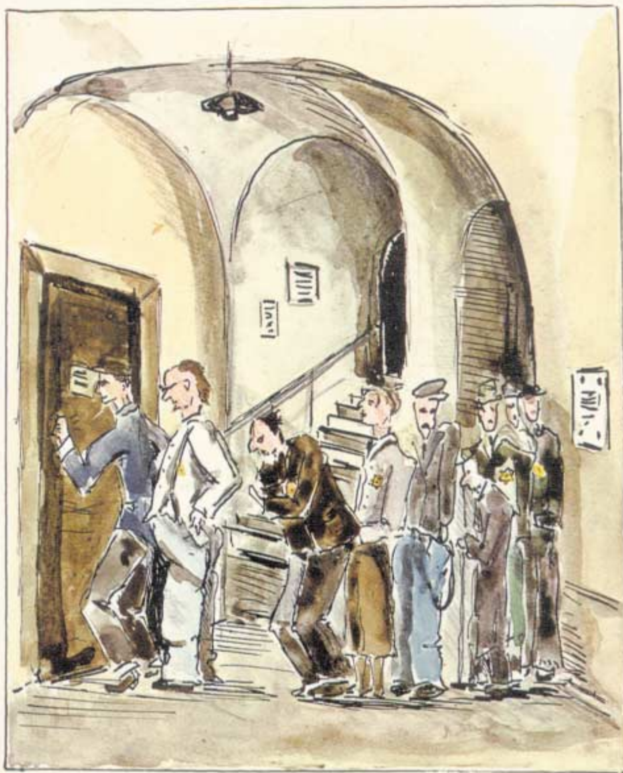
ONE TOILET FOR 1000 people

Due to malnutrition diarrhea and dysentery were common diseases. Later latrines were dug