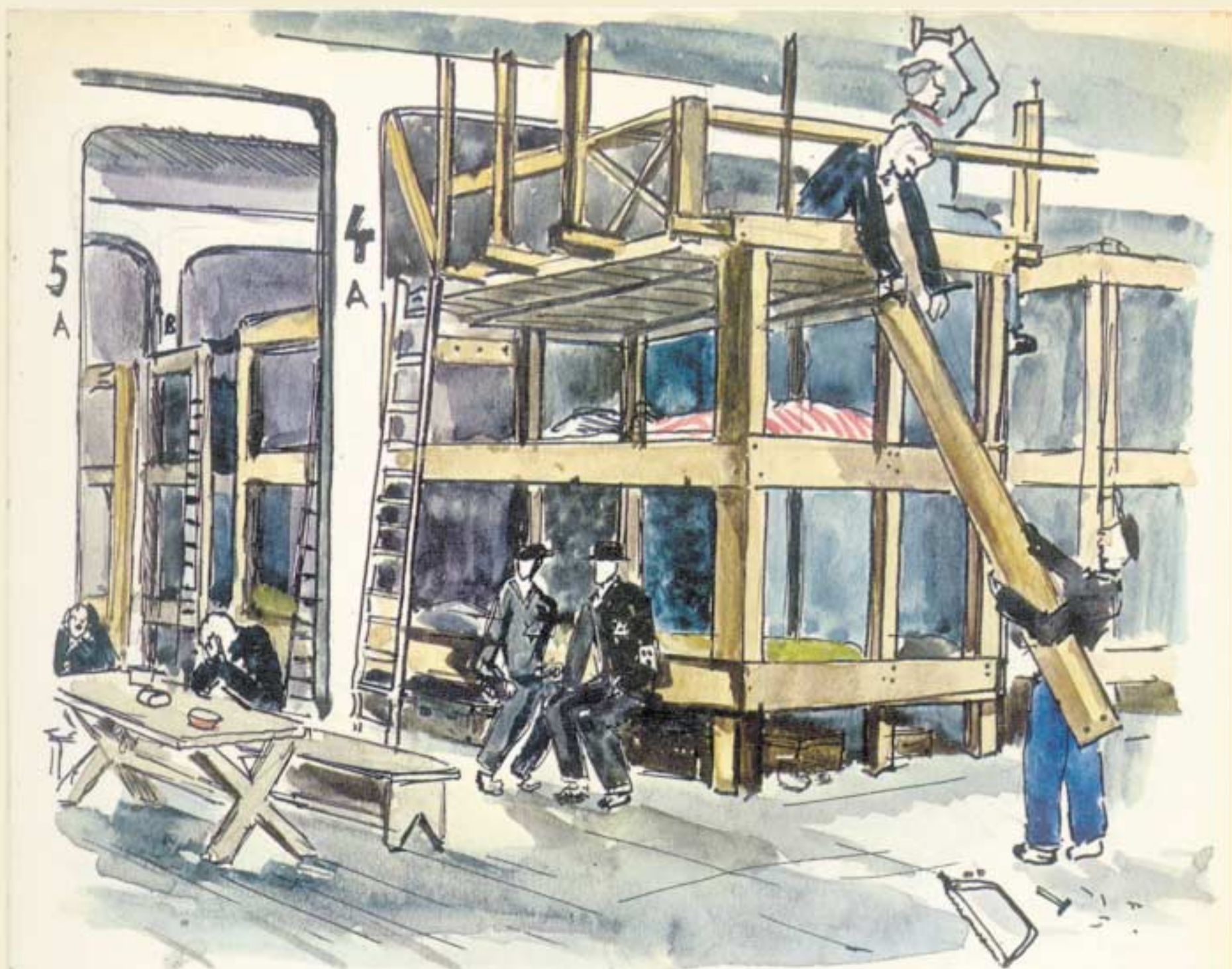
Building "flats" on the beds with stolen boards (appartements)