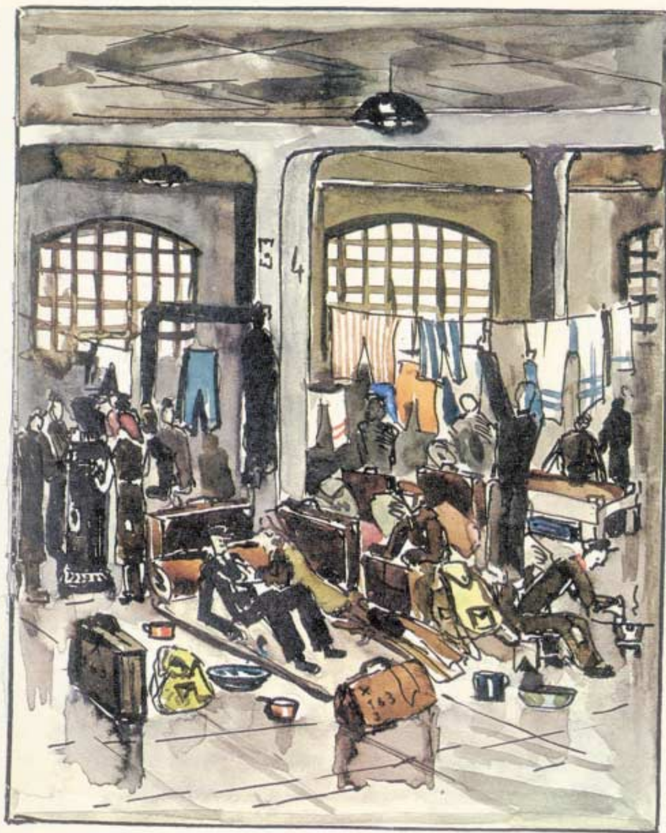
70,000 persons living in a small town formerly equipped for 3000 soldiers Temperature 6 above zero centigrade (39°f) suitcases are only means securing privacy of bitterly fought for 6x2 feet plot.