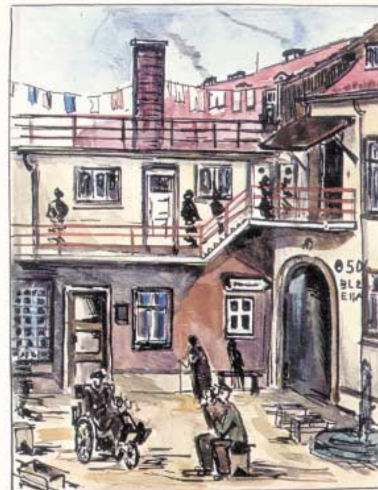
Q 506 Yard where Eva lived Formerly a hotel, now serves as home to 500.

Czech police, assigned to guard camp, often went where to look for a swiped tomato or turnip out of Gestapo gardens. Charge was usually: sabotage on the German Empire - penalty often death. 13