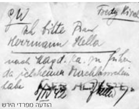
הודעה מפרדי הירש

שאלה מכרעת עולה מתוך מכתב העוסק בפנייה לקונסול הצ'כי בירושלים, על האפשרות להשיג רישיונות עלייה לעצורים בבירקנאו, וב-16.5.1944 התכתבויות עם הצלב האדום הבינלאומי מופנות לדר' פריץ אולמן בג'נבה על מצב היהודים בטרזין. ■