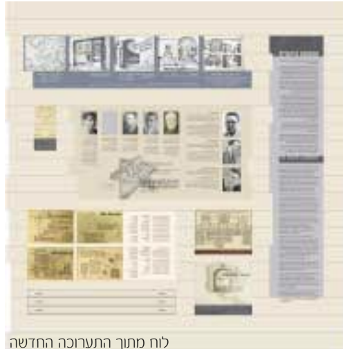
לוח מתוך התערוכה החדשה

מכתבים אלה ממחישים את אין האונים של מי שאיננו יודע לאן הוא נלקח ולמה. חשוב להמחיש למבקר בתערוכה כי מה שאנחנו יודעים היום, בדיעבד, על השואה ועל הגטו, שונה מאוד מהמידע ובעיקר מחוסר המידע, שהיה אז בידי הקורבנות והדריך את מחשבותיהם ואת התנהלותם. התערוכה עוסקת גם במבצע הנאצי, במטרותיו ובשיקוליו באשר להקמת הגטו, ולמקומו במנגנון "הפתרון הסופי". בשל