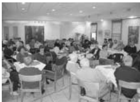
בית פתוח בבית טרזין - יום השואה תשס"ז

נזכיר גם את חברינו המתנדבים, העושים יום יום בתרגום מסמכים, זיכרונות, יומנים וספרים. רוב החומר מתורגם ומוקלד ישירות באמצעות המחשב, אך יש בין המתנדבים מי שעדיין מעדיפים את מכונת הכתיבה. התרגום המודפס מוקלט אחר כך במחשב, לשמירה דיגיטלית. ■