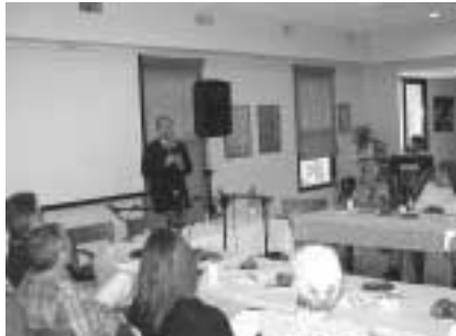
חברת ריהק, נספח תרבות, השגרירות הצ'כית.